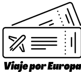
Figura 1. Portada del diario de lectura. Elaboración propia.