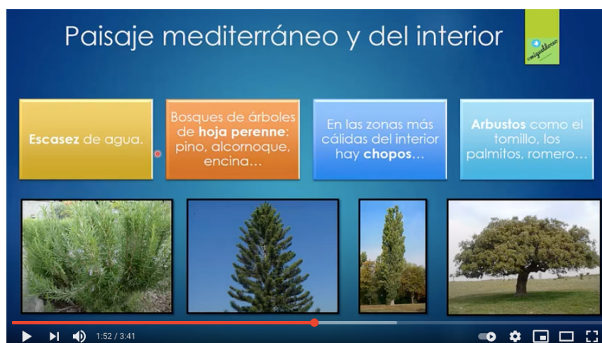
Figura 3. Ilustración del vídeo Sociales-Los paisajes de España . Recuperado de https://youtu.be/J04oFowHjIU .