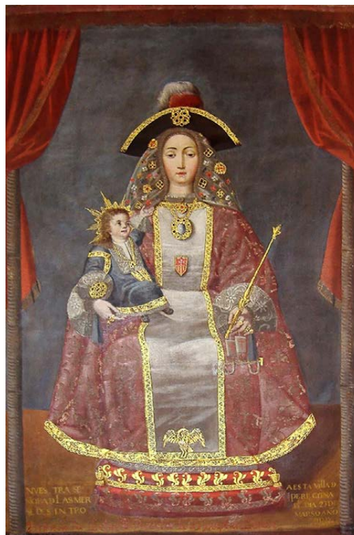
Figura 3. Melchor Pérez Holguín, Virgen de la Merced Peregrina 1732, Convento de San Francisco de Potosí.

pinturas en forma de escritura sobre papel, que llegan a adquirir la forma de libros o códices. Pinturas, lienzos, cuadros, laminas, que el mismo misionero, una vez conocida la lengua indígena, explicaba. En este estadio, a diferencia del primero, las pinturas se convierten en recurso didáctico que ilustra las palabras del religioso 8 .