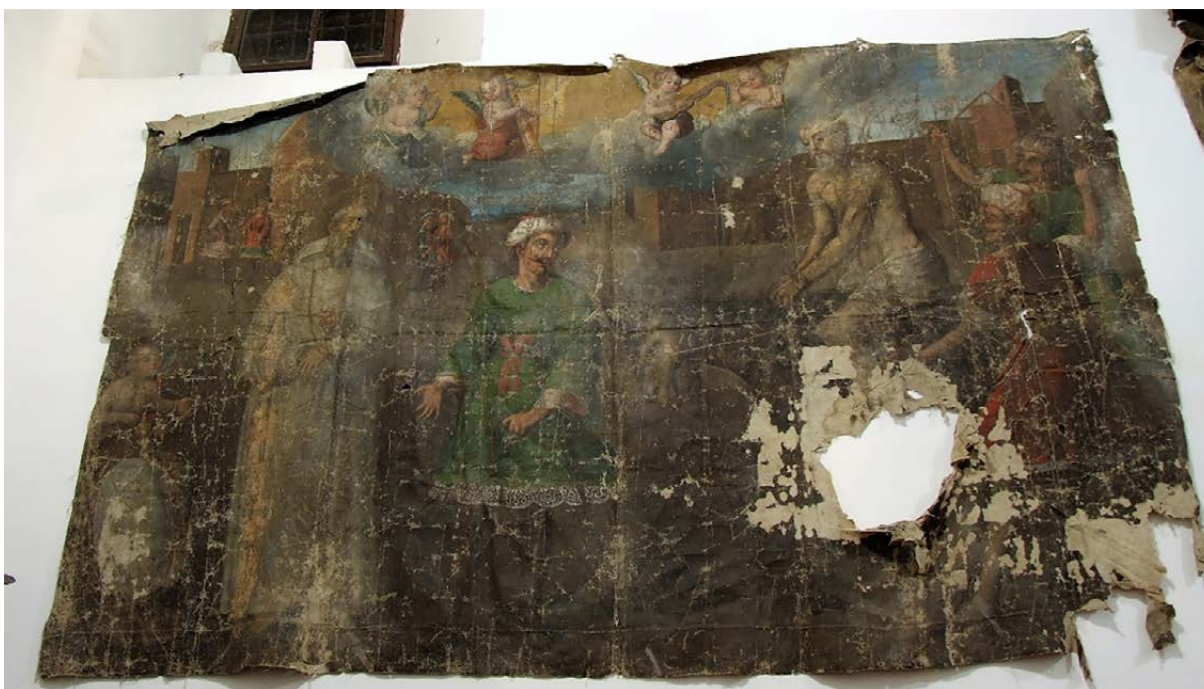
Figura 8. Anónimo. El tormento en Argel de san Pedro Nolasco . S. XVIII. Iglesia de la Merced de Potosí.