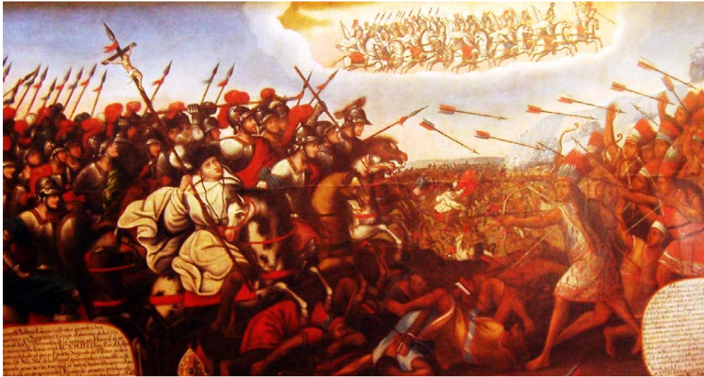
Figura 2. Anónimo, Conquista de Santa Cruz de la Sierra, a los indios Chiriguanos . Siglo XVIII, Convento de la Merced de Cuzco.

en México, en donde a pesar de la presencia de fray Bartolomé de Olmedo no consiguen por diversas prohibiciones fundar el primer convento hasta 1592.