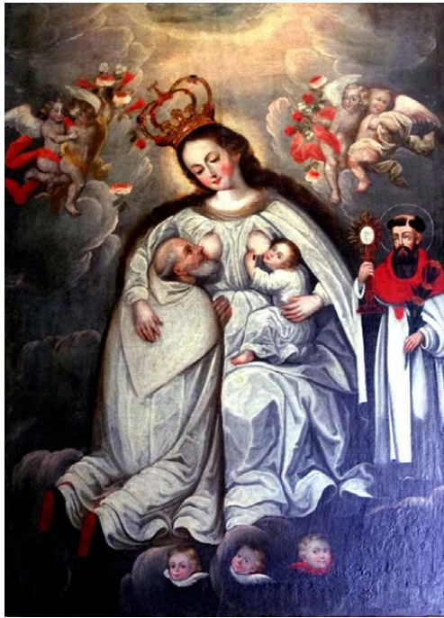
Figura 4. Anónimo. Lactación de San Pedro Nolasco, s. XVII. Museo histórico regional de Cuzco.

Los santos mercedarios son propuestos como modelos de santidad e intercesores siguiendo la dogmática tridentina, su devoción se extiende como imagen devocional en los conventos y es en ellos donde encontramos las imágenes y tallas del fundador y los primeros santos de la Orden, todos ellos elevados al honor de los altares a partir del siglo XVI: San Pedro Nolasco, fundador de la orden, San Ramón Nonato, San Pedro Pascual, San Serapio, San Pedro Armengol, Santa María de Cervelló, fundadora de la rama femenina de la Orden de la Merced y protectora de navegantes o la beata Mariana de Jesús.