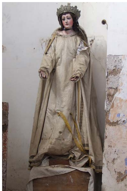
Figura 7. Virgen de la Merced . Imagen procesional del siglo XVIII, Escuela Cuzqueña. Sacristía de la Iglesia de la Merced de Sucre.

nos pueden servir como llamada de atención y preocupación; al tiempo que gracias a iniciativas como el presente congreso nos sirvan de estímulo en nuestra labor en pro de la preservación del patrimonio frágil.