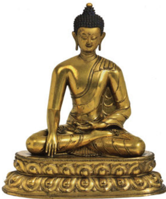
60. Estatua de Shakyamuni Tibet Bronze dorado 36 x 20 x 41 cm Statuette de Shakyamuni Tibet Bronze doré 36 x 20 x 41 cm