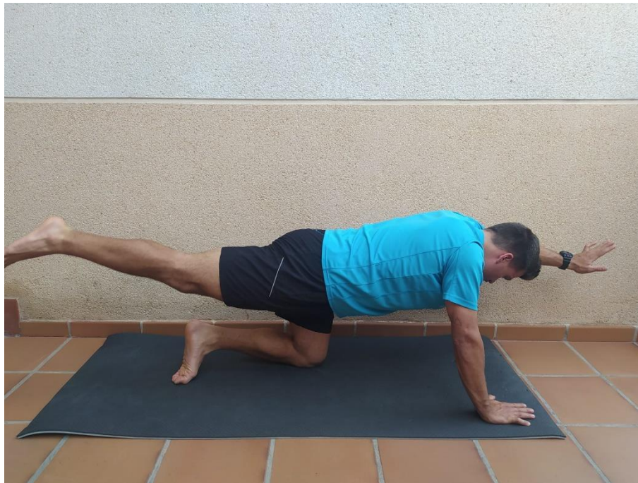
Postura 1. Superman.