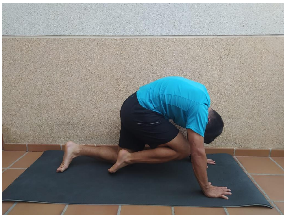
Postura 2. Corredor