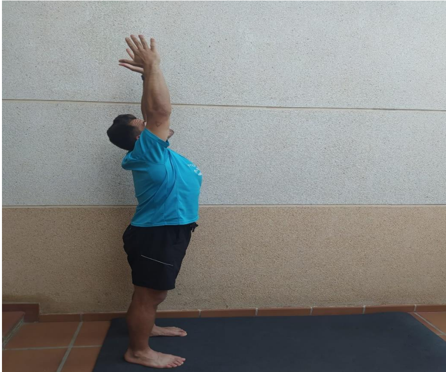
Postura 5. Palmera.