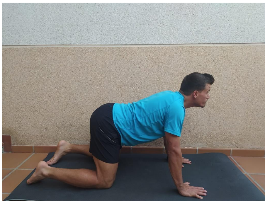
Postura 3. Vaca.