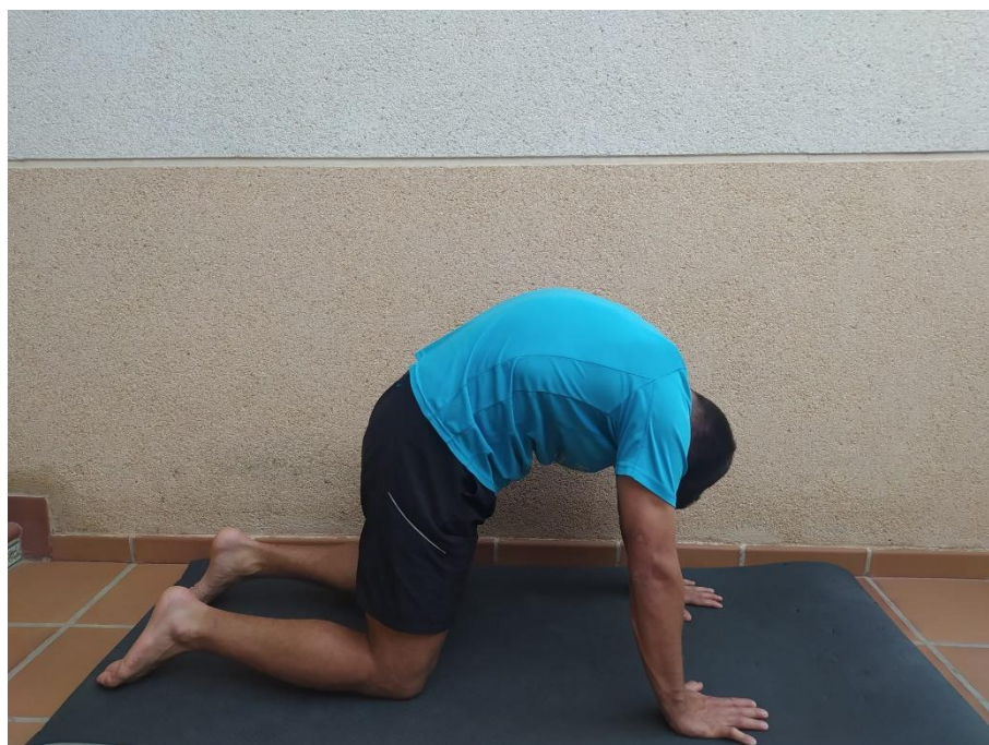
Postura 4. Gato.