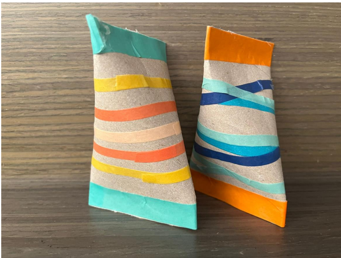
Figura 11 Maracas recicladas

Cuando todos los alumnos terminen las suyas se puede jugar a hacer distintos ritmos musicales o a adivinar que elemento han guardado por el sonido que hace al mover la maraca.