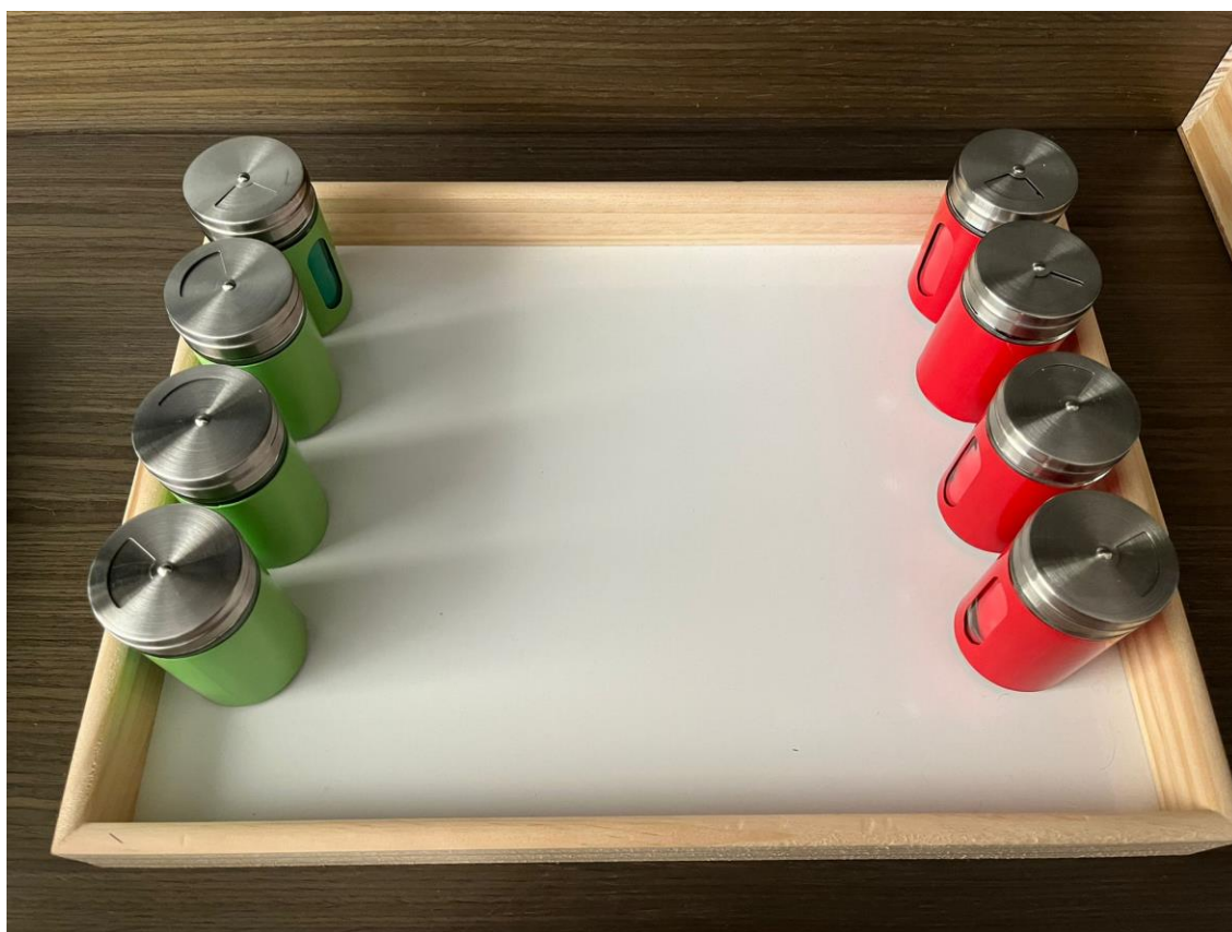
Cilindros olores Montessori