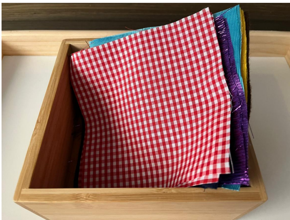
Caja telas Montessori