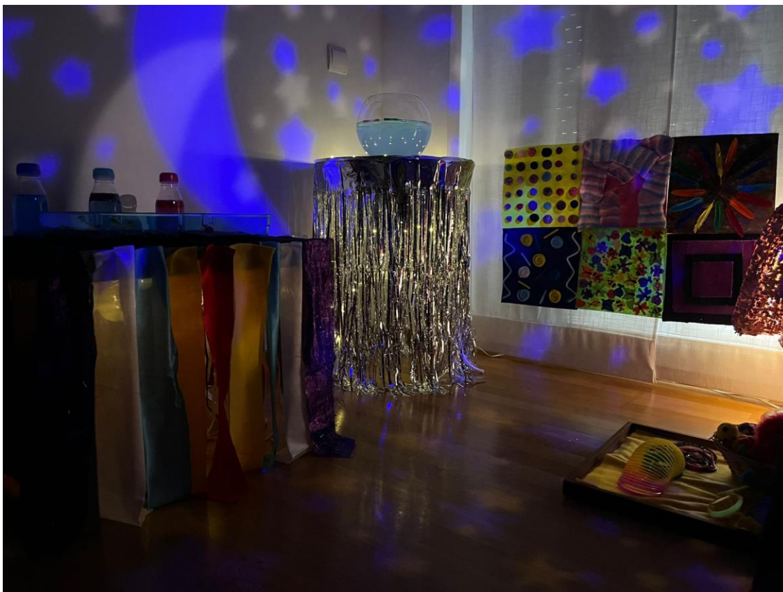
Figura 12 Sala multisensorial