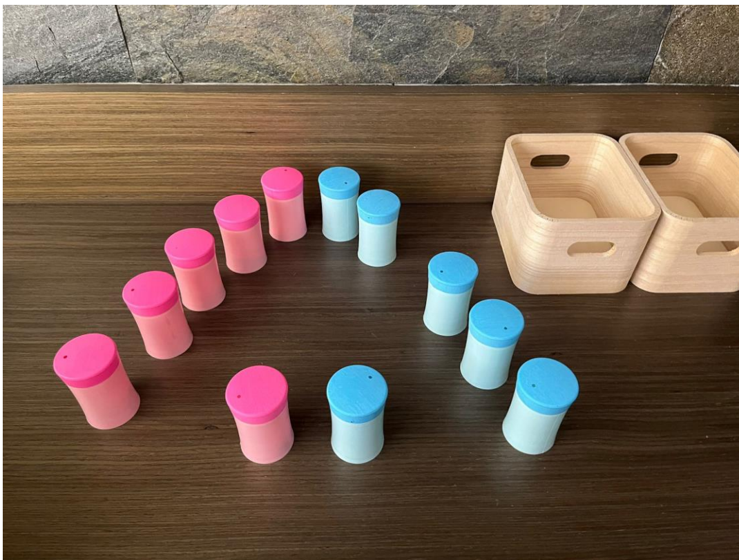
Figura 7 Cilindros sonido Montessori