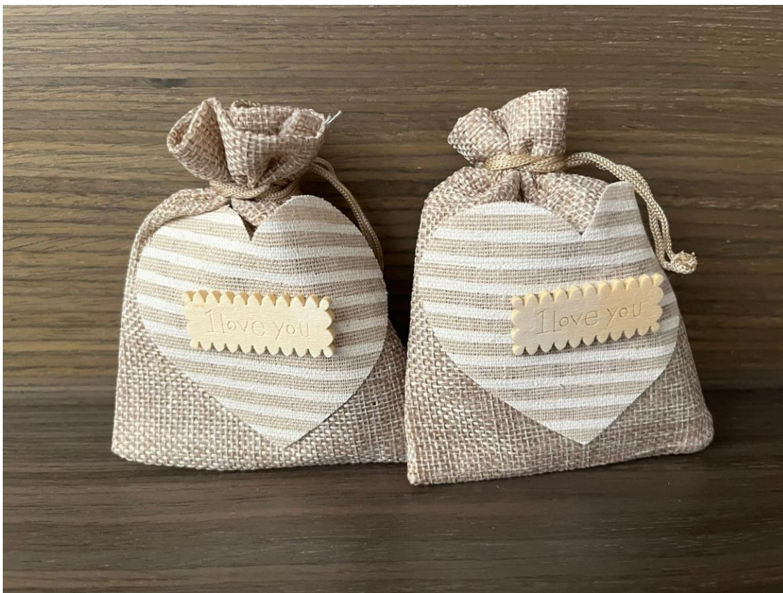
Figura 10 Ambientadores