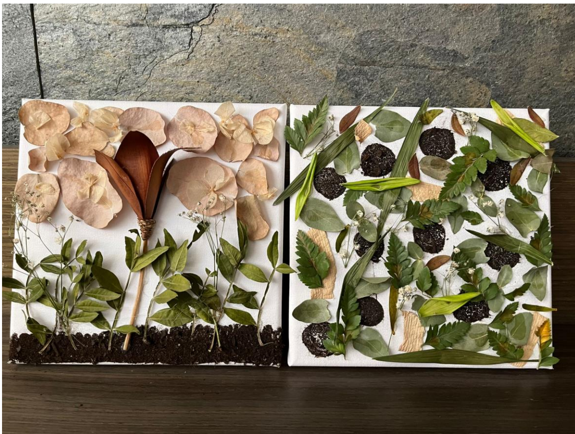
Cuadro de texturas