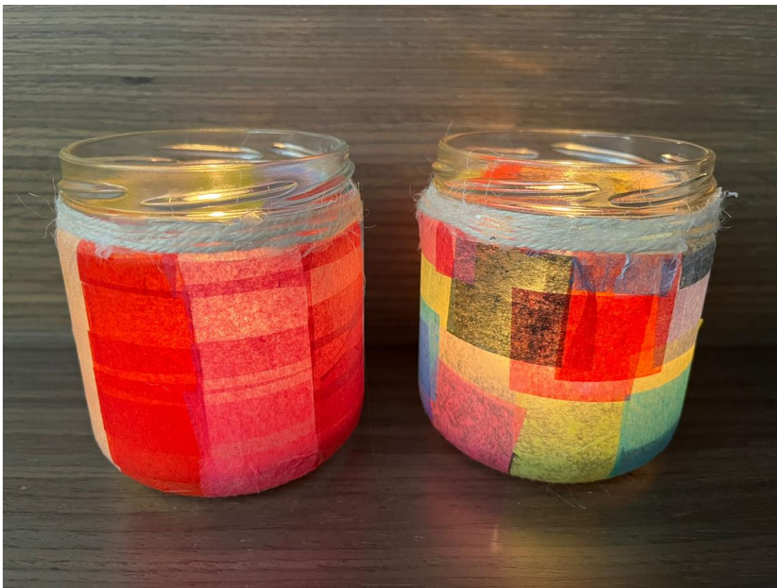
Figura 8 Velas