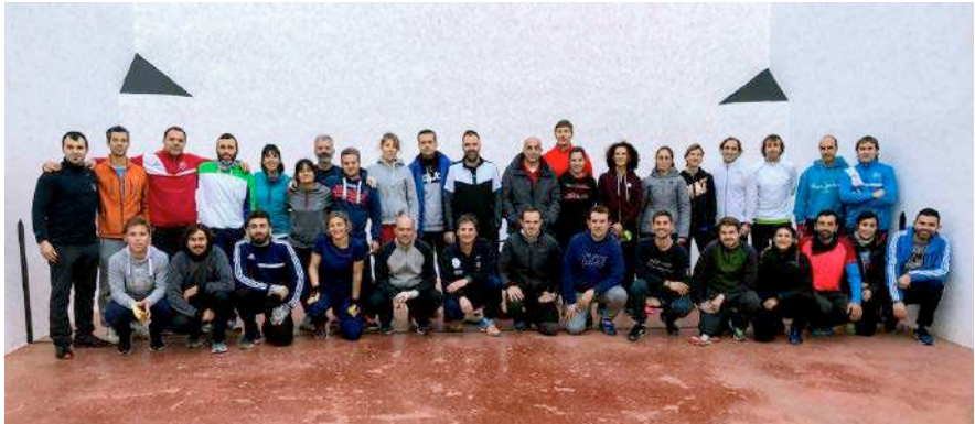
Figura 1. Alumnat de la jornada de formació del professorat d'educació física "Enganxa't a la pilota valenciana. Va de bo!" organitzada pel CEFIRE el 19 de gener de 2018.

Cal un acostament urgent per part de les administracions públiques, les federacions esportives (incloent als clubs) i els centres educatius i els seus professionals, per d'aquesta forma, aconseguir programes d'esport escolar concordes amb la cultura física del context en el qual són implantats (programes socials i eficients) i fomentar una activitat física que atén els criteris aportats pels experts en la matèria (campanyes de sensibilització). És a dir, els jocs i esports tradicionals han de mantenir la seua idiosincràsia, però preservant les necessitats i drets dels practicants de diferents àmbits, com per exemple, de l'àmbit escolar (pàg.6).