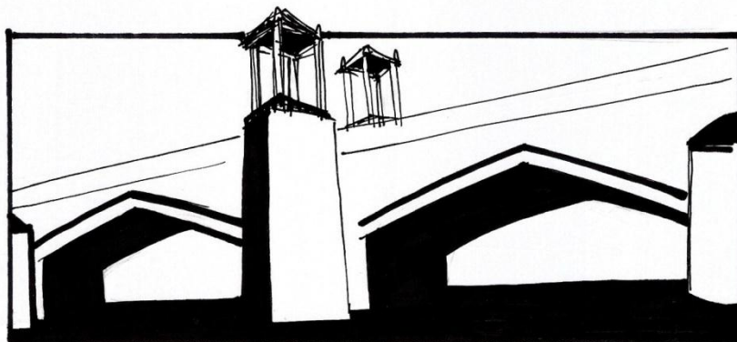
Pont de la Mar. València (Ilustración de Ferran Cortés)