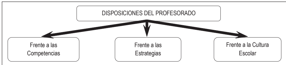
GRÁFICO 2. Disposiciones del profesorado

Para conocer las disposiciones del profesorado frente a las competencias , se emplea un cuestionario pre-test y post-test diseñado teniendo en cuenta los recursos que se requieren para construir una competencia 3 . El propósito del mismo, siguiendo a Bronfenbrenner, es actuar en el nivel microestructural, es decir, en la dimensión personal del profesorado en relación con las competencias propuestas; la primera fase de la propuesta de formación (sensibilización-conceptualización) apunta a producir las transformaciones que el profesorado requiere para fortalecer este tipo de disposición.