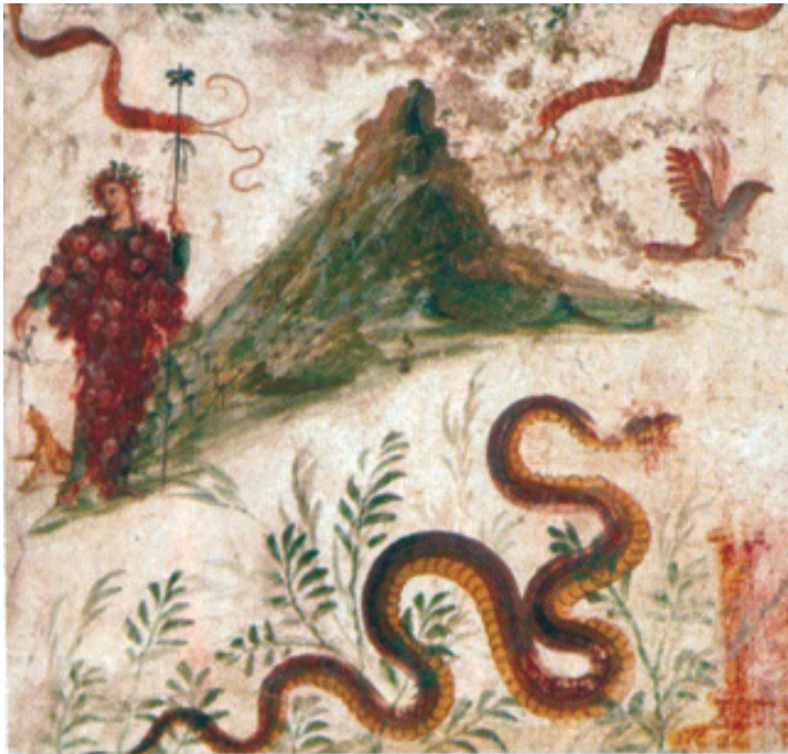
Fig.1. Las primeras plantaciones de viñedos y la elaboración de vino en la provincia Tarraconensis se debió a la iniciativa de individuos itálicos, algunos de ellos procedentes de Campania. El fresco de la casa del Fauno en Pompeya representa al dios Baco transformado en un racimo de uva junto al Vesubio. Liber , junto con Ceres y Líbera , forman la tríada de las divinidades agrarias romanas. Liber , como divinidad asimilada a Baco, se convirtió en el dios del vino y de los vendimiadores, siendo Campania el lugar originario de este culto cuya difusión por la Tarraconensis está documentada.