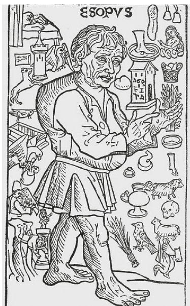
Frontispicio de una edición española de las “Fábulas de Esopo” (1489).

Con la ayuda de algunos repertorios de refranes y los resultados de una pequeña encuesta realizada entre personas de distinto nivel cultural y de diferentes edades, podríamos conjeturar que de esos 27 proverbios hay al menos 11 que conservan una importante presencia en el habla coloquial; son los siguientes: “La ocasión la pintan calva”. “La cogí por los pelos”. “Andar como puta por rastrojo”. “Matar la gallina de los huevos de oro”. “Aunque