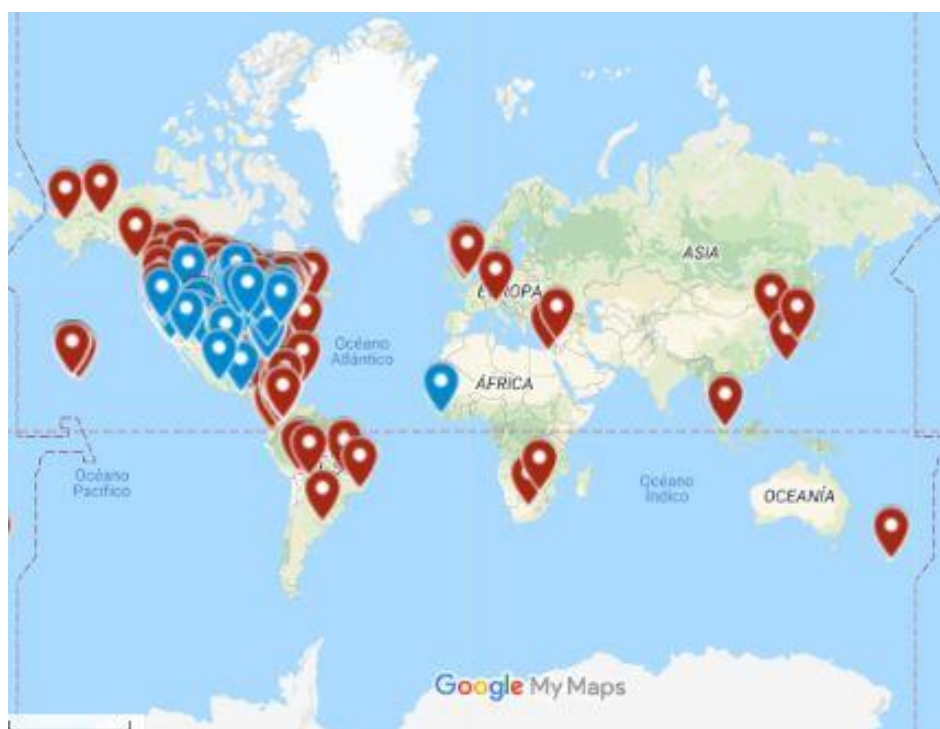
Centros del mundo que implementan el programa Character Counts!