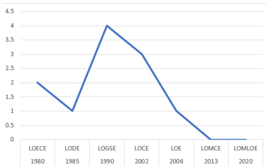
Figura1 Menciones sobre la dimensión moral de la educación en la legislación

Dentro del marco legislativo de la educación española y teniendo en cuenta las leyes aprobadas a lo largo de los años, podemos comprobar cómo encontramos una disminución del número de artículos, en las diferentes normativas, dedicados a la educación en la dimensión moral (véase figura 1).