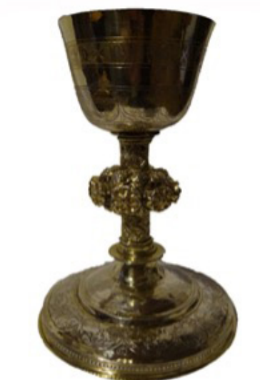
Fig. 2. Anónimo. Cáliz ¿de la cofradía del Santísimo Sacramento de Ávila? c. 1525. Parroquia de Santiago Apóstol de Ávila.

Tal crecimiento y difusión debe situarse en su contexto histórico adecuado, ya que todo este fenómeno devocional a principios del siglo XVI se estaba desarrollando en un ambiente marcado por el auge protestante, de forma que la fundación de las congregaciones podría leerse en clave contrarreformista. Eran un recurso destinado a afianzar la fe católica y uno de sus fundamentos dogmáticos, el de la salvación a través de Cristo sacramentado, en línea con los preceptos dictados por el Concilio de Trento (1545-1563).