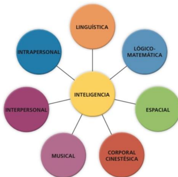
Esquema de las inteligencias múltiples