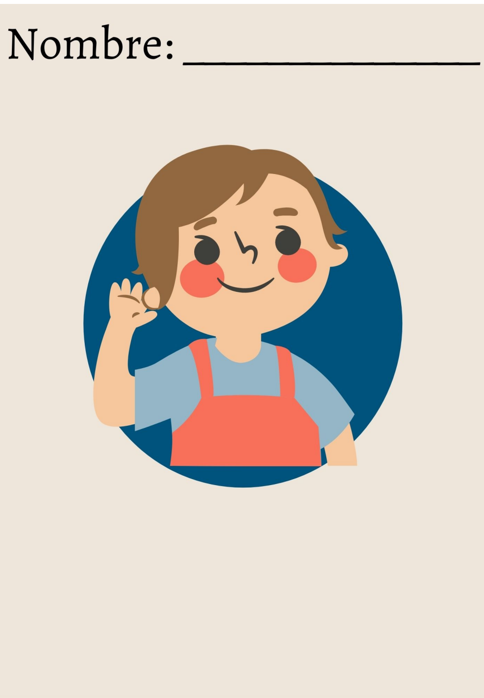
Figura 4. Ejemplo actividad día 5 (Elaboración propia, 2021)