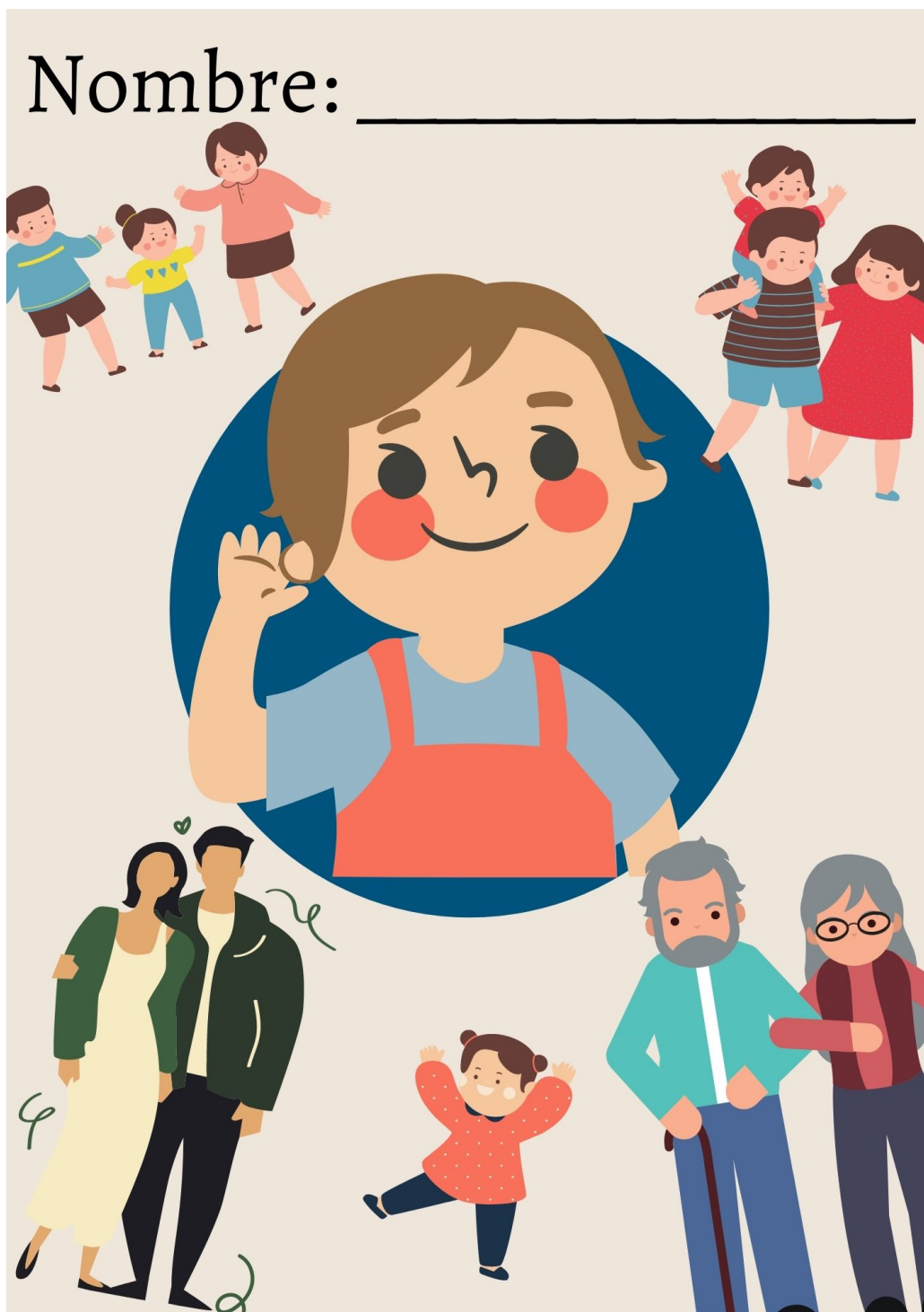
Figura 5. Ejemplo actividad día 6 (Elaboración propia, 2021)