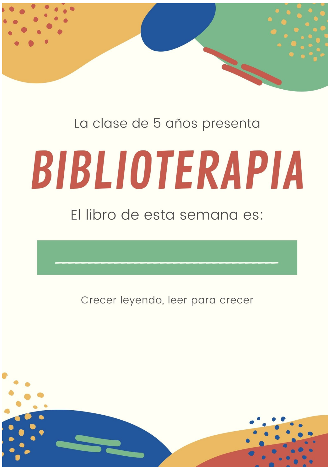
Figura 2. Biblioterapia (Elaboración propia, 2021)