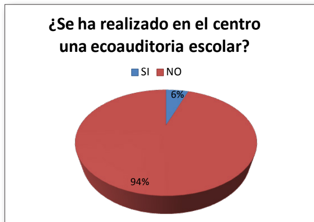
Fig. I. Realización de Ecoauditoria Escolar

La Ambientalización Curricular de los centros educativos encuestados también pudo ser valorada a través de la obtención de datos de implantación de Sistemas de Gestión Medio Ambiental, porque como ya se ha expuesto anteriormente la AC implica también la coherencia y la contextualización de una gestión sostenible del centro