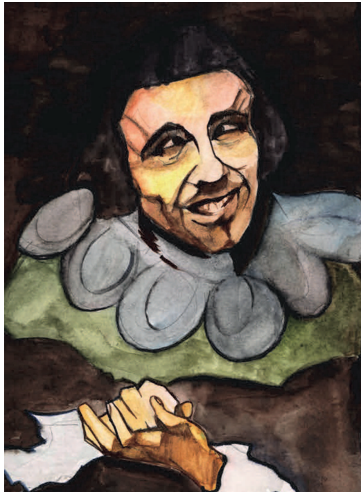
El Bufón Calabacillas de Velázquez. Ilustración de Isabel Torreblanca

Para Morel d'Arleux el Bufón Calabacillas muestra una personalidad ambigua, donde se conjugan la necedad y la inteligencia, lo repulsivo y la seducción. La misión del bufón en la corte es la de provocar la risa; mas al mismo tiempo y por esa misma función, es capaz de reírse del noble más encumbrado o del clérigo más riguroso. Por tanto, es posible presentar al bufón, y así lo consideramos, como un sabio que juega con la ambivalencia, la ambigüedad y la distorsión de la realidad.