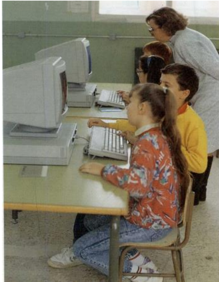
Figura 2 Proyecto Atenea. Experiencia de aula