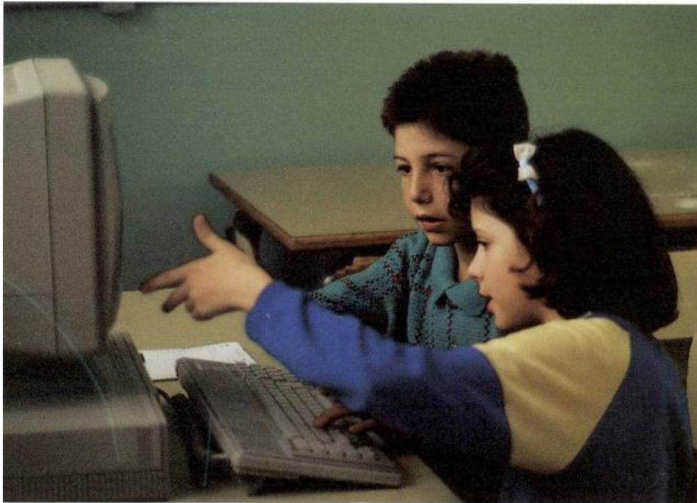
Figura 1 Proyecto Atenea. Prueba práctica