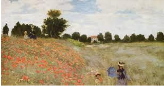
Guernica – Pablo Ruiz Picasso