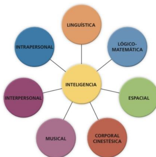
Esquema de las inteligencias múltiples

Nota. Fuente: “Inteligencias múltiples” de M. García (2010, p. 3)