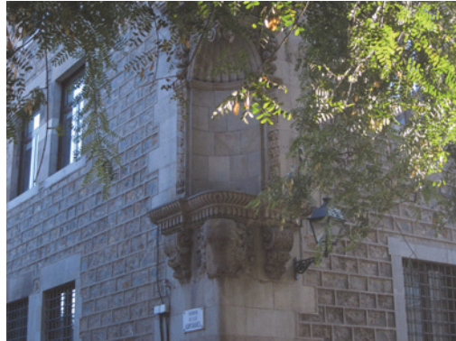
Fig. 1 Hornacina. Joaquín Jara

Consiste en integrar en el paisaje piezas fabricadas específicamente para el lugar donde van a ir colocadas añadiéndole la pátina y textura de su futuro emplazamiento. Estos emplazamientos son hornacinas religiosas o pedestales vacíos pertenecientes a la ciudad de Barcelona.