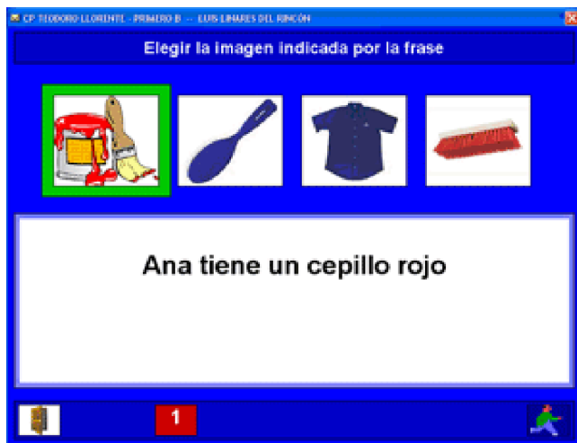
Figura 3 Elegir la imagen que corresponda a la frase

y colectivamente a los alumnos y emite dos informes escritos de la evaluación. Comparando las gráficas periódicamente se conoce a simple vista la evolución del alumno.